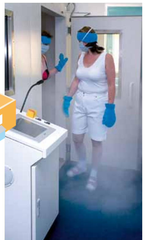
Die Kältekammer besteht aus 2 Sektionen, in denen unterschiedliche Temperaturen herrschen: -60°C und -110°C.

Da die Kosten einer Ganzkörper-Kältetherapie in Deutschland erheblich höher sind und in der Regel nicht von den Krankenkassen übernommen werden, sollten Sie dieses günstige Angebot nutzen.